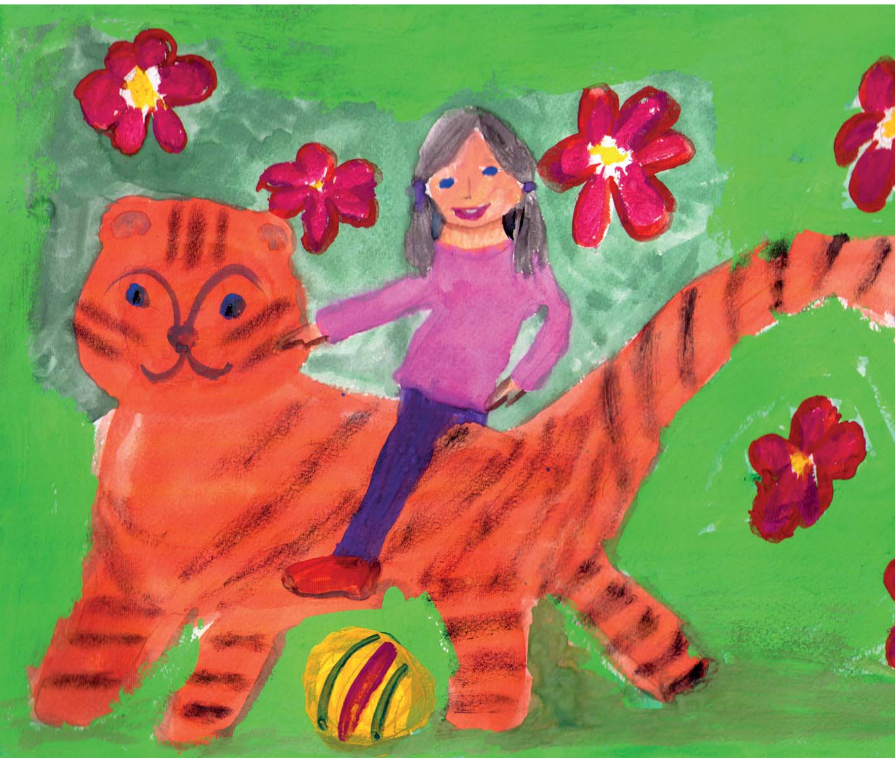
Карина Косакян, 7 лет. «Вместе весело играть!»