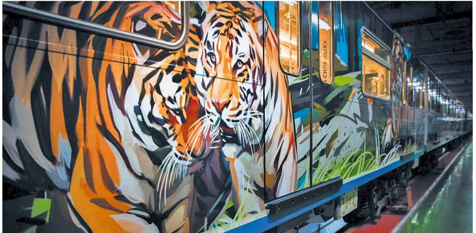
Вот такую красоту можно увидеть в метро.

За достоверность изложенных в составе фактов отвечали эксперты Центра «Амурский тигр» и АНО «Дальневосточные леопарды», а визуальное наполнение разработали ведущие молодые иллюстраторы из разных городов России и... нейронная сеть - один из вагонов проиллюстрирован при участии компании Prisma Labs, разработчика суперпопулярного приложения Prisma. Основатели компании предоставили проекту ресурсы собственной обученной нейронной сети. Взяв за отправную точку изображения амурского тигра, дальневосточного леопарда и живописных видов территории их обитания, она создала