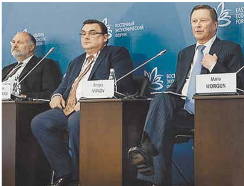
Панельная дискуссия в рамках Восточного экономического форума. Сергей Донской, Константин Чуйченко и Сергей Иванов - о грядущем Гode экологии.

«На Дальнем Востоке мы имеем уникальный животный мир, реликтовые растения. Пятая часть территорий Приморского края, который сам по себе велик, уже объявлена либо заповедной, либо особо охраняемой, - рассказал Сергей