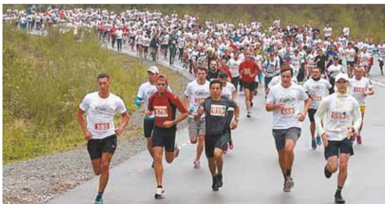
В забеге приняло участие около 700 человек.

составляет 20-30 особей, - сказал Константин ЧУЙЧЕНКО, председатель наблюдательного