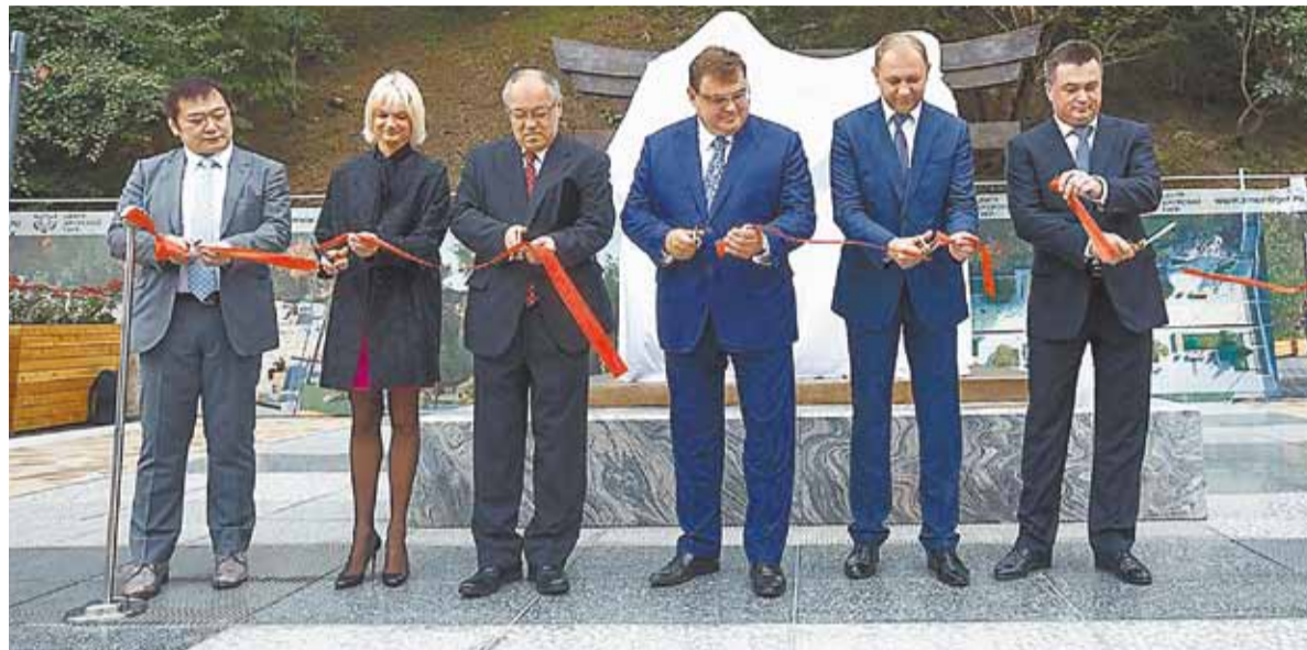
Церемония открытия памятника.