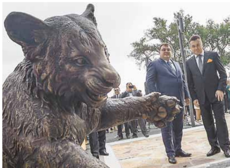
Тигрёнок - «основатель» самбо.

одну из своих кинокартин гению российского дзюдо и самбо, решившему соединить возможности человеческого тела с грацией и силой амурского тигра и обычной кошки в одном боевом искусстве. Мы считаем, что о большом деле Василия Сергеевича должно узнать как можно больше людей. Ведь этот человек не только соединил воедино экологию и борьбу за сохранение тигра со спортом, но и подал хороший пример всем последующим поколениям. Благодаря вкладу великого дзюдоиста многие молодые люди вынесли для себя жизненное правило - сильный и уверенный в себе человек никогда не позволит себе стрелять в амурского тигра и сделает всё от него зависящее, чтобы этот вид животных процветал на нашей планете. Я хочу поздравить всех с Днём