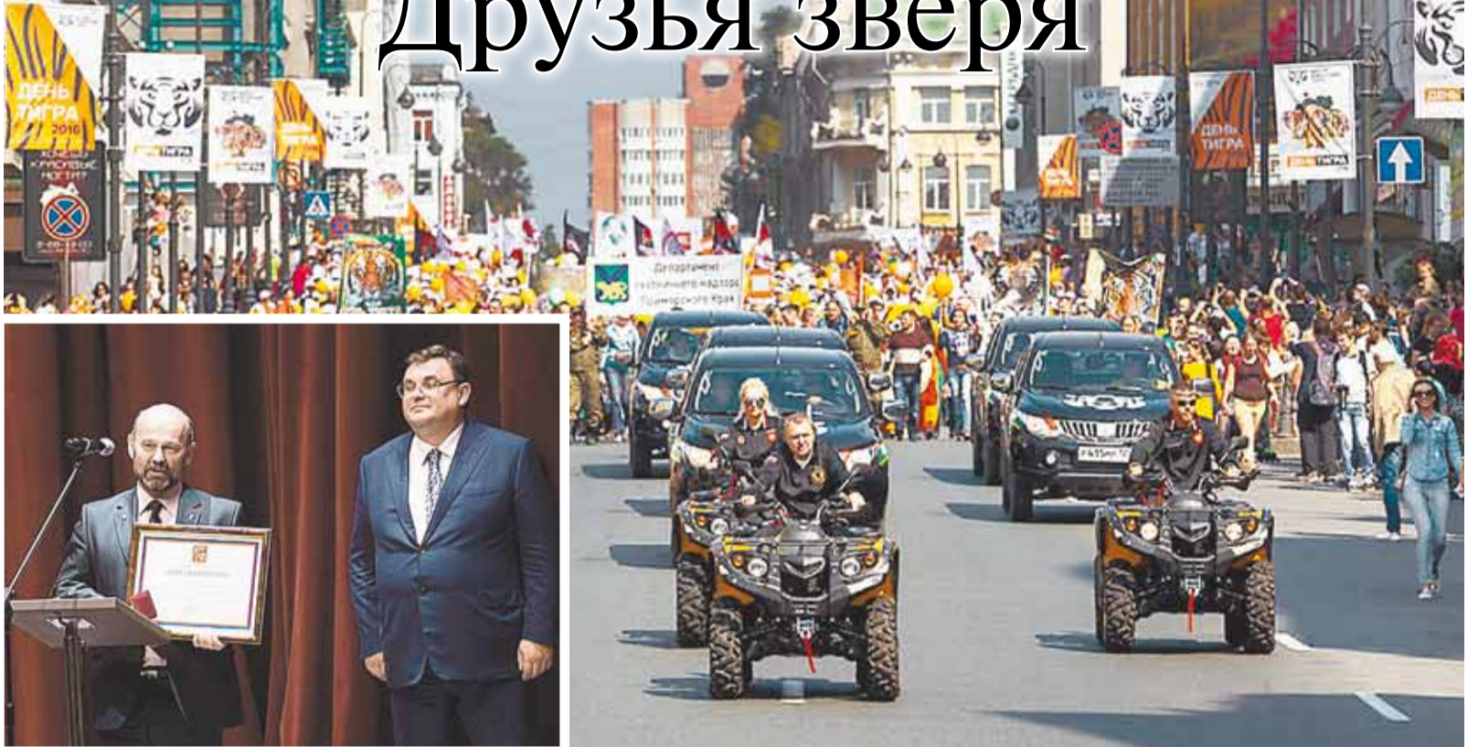
Участники воскресного парада вечером получили заслуженные награды.