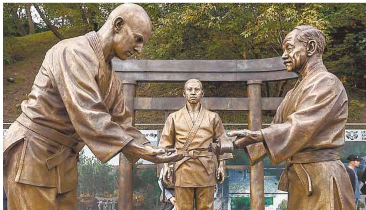
Учитель и ученики - в бронзе.

ЧУЙЧЕНКО, помощник Президента России, председатель наблюдательного совета Центра «Амурский тигр». - Впоследствии великий японский режиссёр Куросава посвятил