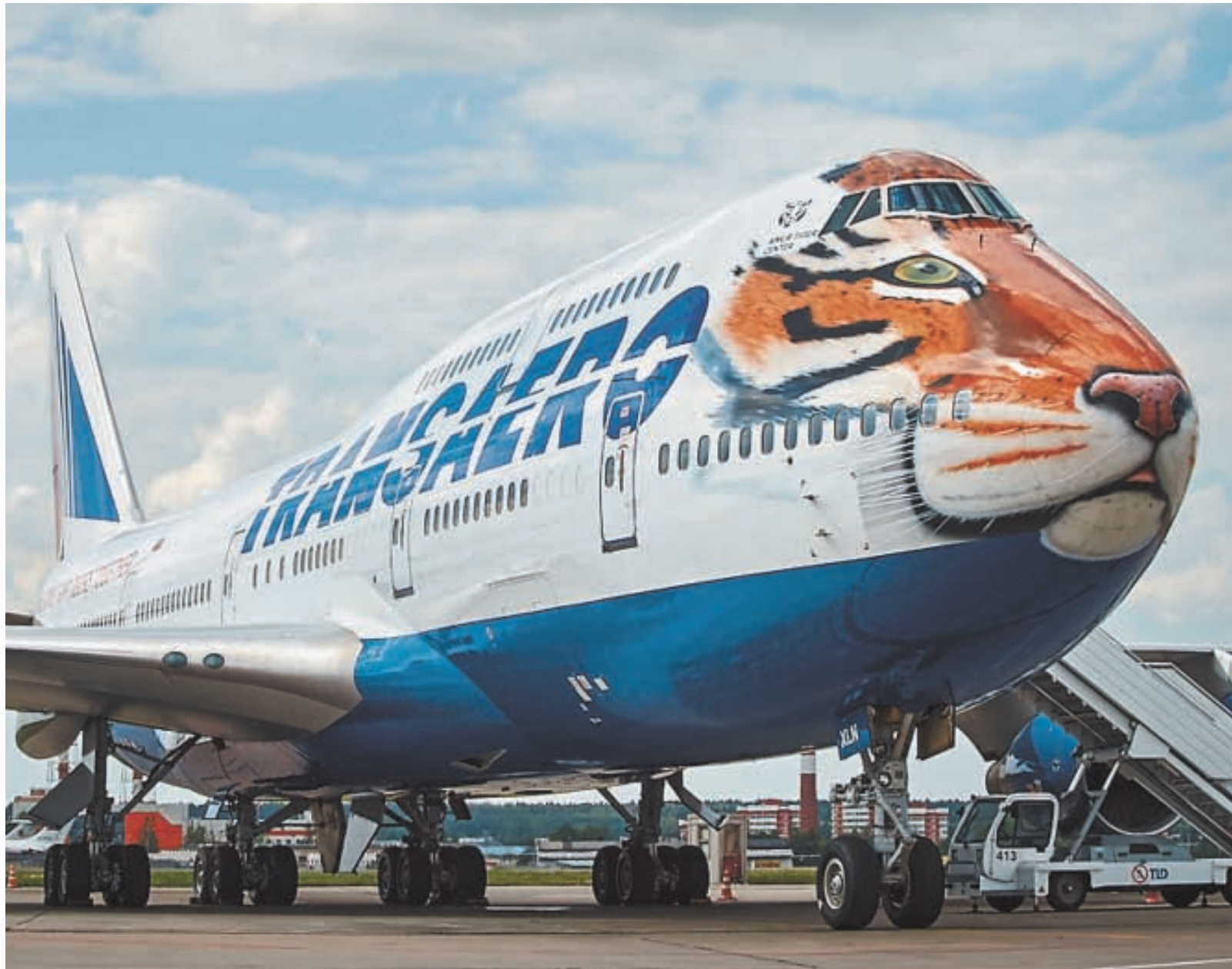
Гигантский двухэтажный самолёт приобрёл морду хищного зверя...

Покрасочный цех находится по соседству со зданием аэропорта. Он огромен. Здесь чувствуешь себя лилипутом. Ангар напоминает гигантскую игрушку-трансформер. Или кубик Рубика внутри. Подвесные площадки, конструкции, подобные строительным лесам и авиационным трапам, появляются откуда ни возьмись, буквально спускаются с потолка, двигаясь в разных плоскостях, либо подкатываются со стороны, где их заготовлено огромное