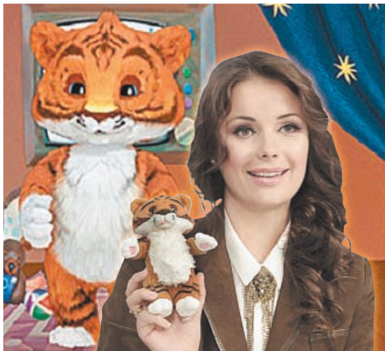
Оксана Фёдорова и её маленький друг тигрёнок.

Интересно, что тигрёнок, в отличие от своих «коллег» Хрюши, Степашки, Фили, Каркуши и Мишутки, не просто кукла - он компьютерный и интерактивный. Тигрёнок выполнен мультипликаторами в технологии 3D, но, как и остальные персонажи, активно общается с ведущими. Мур, как и все тигрята, имеет довольно вспыльчивый, озорной характер, но легко отходит и вновь становится ласковым.