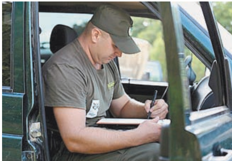
Инспектор в форме, полученной от Центра «Амурский тигр».

Бесконтрольный отстрел копытных подрывает кормовую базу амурского тигра. Истощённые животные в поисках пищи вынуждены приближаться к населённым пунктам, где их жертвами становятся собаки и скот, - это приводит к конфликтам с людьми, финал ко-