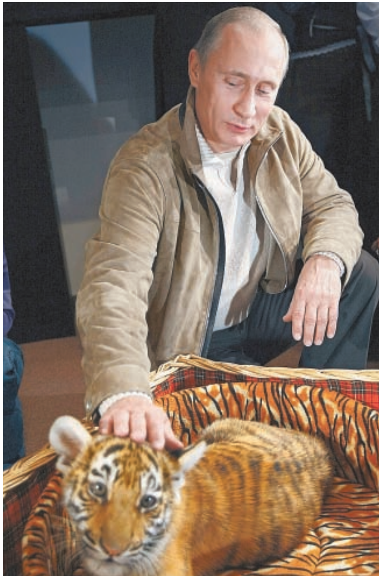
Судьба амурского тигра в надёжных руках.

уделять случаям нарушения законодательства в сфере экологии гораздо больше внимания, а с населением ведётся активная работа по экологическому просвещению. Подключились к решению проблемы и средства массовой информации: они стали подробно освещать данную тематику. Для изучения амурского тигра, сохранения и увеличения его популяции в России по инициативе Владимира Путина в 2013 г. была создана автономная некоммерческая организация Центр «Амурский тигр». Учредителем центра выступило Русское географическое общество, традиционно проявляющее заботу о редких видах животных. С момента основания центр приступил к решению задачи по объединению усилий частных лиц и организаций, не безразличных к судьбе популяции полосатого хищника.