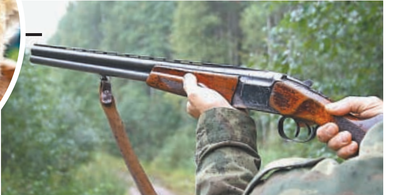
Разве можно стрелять в такого милягу?

рых зачастую наносит урон хозяйству человека, когда он теряет любимых питомцев и «кормильцев», что зачастую ведёт к гибели редкой кошки. «Сейчас упрощена проце-