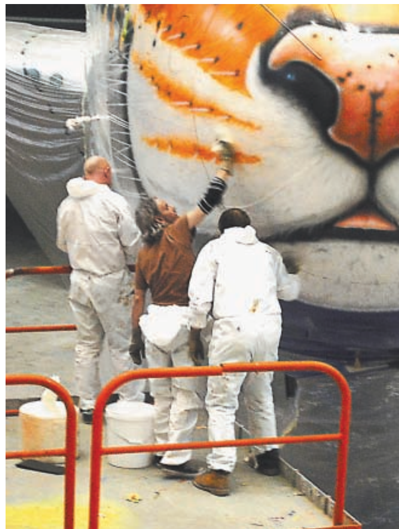
«Работа была непростой, но захватывающей», - говорят художники.

Позаботились организаторы проекта и о внутреннем мире летающего тигра. Со временем некоторые детали салона воздушного судна также получат отличительные тигриные черты, а к визуальной составляющей проекта добавится и